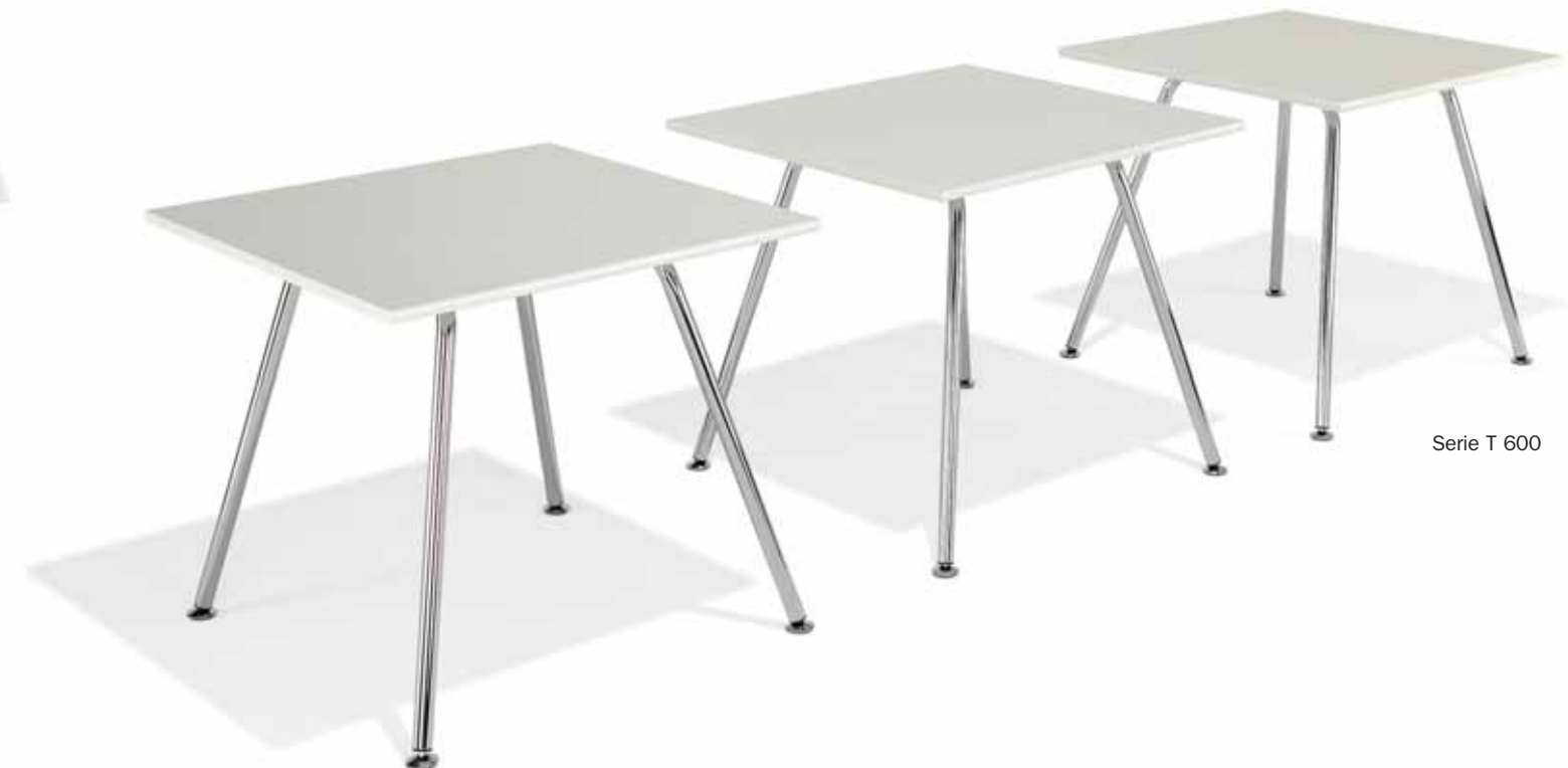
Serie T 600

Het fijne, naar boven toe A-vormige onderstel geeft deze tafels een fraai uiterlijk. Even geschikt voor vergaderingen, conferenties en cursussen als voor cafeteria's en verblijfruimtes. Design: Prof. Stefan Lengyel.